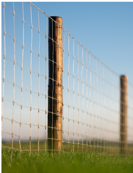
CLÔTURES DE PRAIRIES