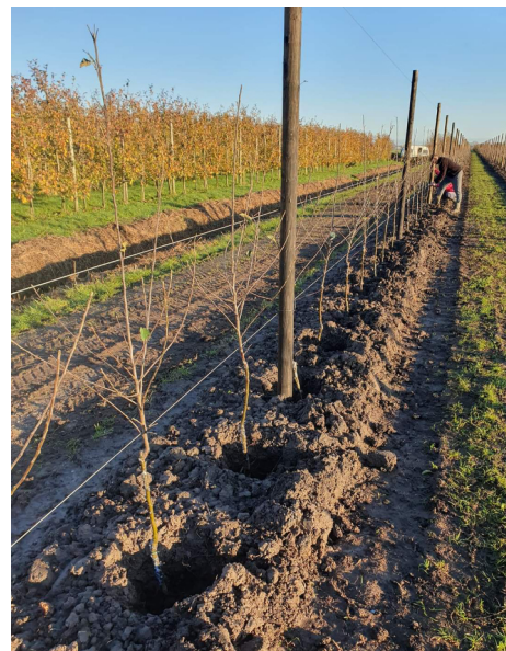
PALISSAGES POUR ARBRES FRUITIERS